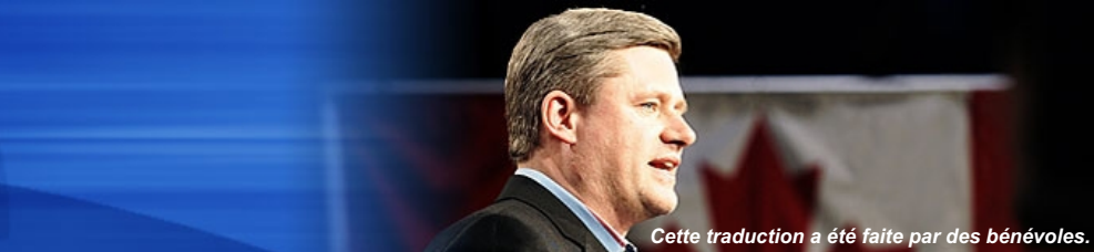
Cette traduction a été faite par des bénévoles.

les RÉSULTATS PARLENT on tient parole Conservateur